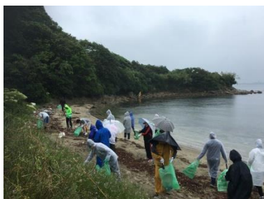
皆さん、雨具持参で 清掃活動を頑張りました。