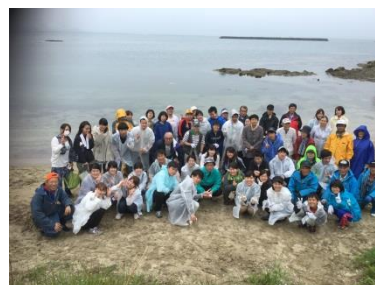
大勢の方々に ご参加頂きました！