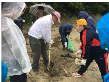
砂浜に埋もれたゴミも 丁寧に取り除きます。