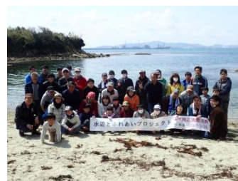
綺麗な景色をバックにみんなで記念撮影！

今回、参加協力頂きました学校・企業・団体・行政 様(順不同・敬称略) 市内外地域の皆様、北九州市漁業協同組合馬島支所、北九州市青少年課ボランティアステーション、浅野工芸舎、NPO法人 北九州環浄研、 瑠璃スキッチン、私たちの未来環境プロジェクト、(株)ケイエス企画、ニホン・ドレン(株)福岡営業所、その他