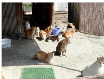
晴天に恵まれ、猫たちの歓迎を受ける？

平成28年度 第5回 馬島清掃団(2017年3月26日実施) 参加者:51名 回収量:426.16kg