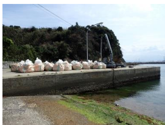
ゴミは港からさらに船で本土へ。島のゴミ問題は大変です。