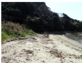
皆さんの力でとっても綺麗になりました。