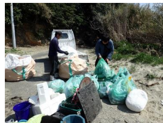
島の人たちも協力して回収したゴミを搬出します。