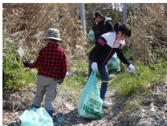
春休みということで、お子さんの参加もありました。