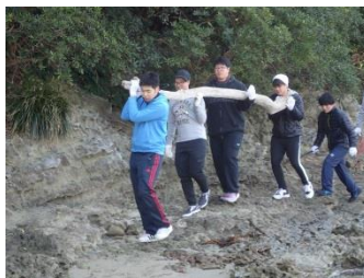
若いパワーで重い流木も軽々？