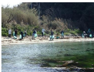
清掃活動スタート。本日も、頑張りましょう！