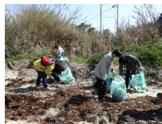
漂着ゴミは相変わらず、プラスチック製品が多いです。